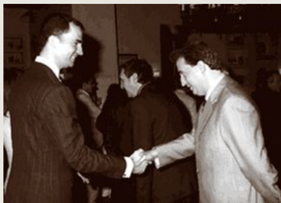
Saludando a S.A.R. el Príncipe de Asturias D. Felipe de Borbón y Grecia

En la actualidad es profesor numerario de música de cámara en el Conservatorio de Alcalá de Henares, simultaneando dicha actividad docente con los cargos de director musical de la Orquesta Sinfónica "Ciudad de Alcalá" y de la Sociedad Lírica Complutense. Al frente de estas formaciones musicales ha actuado en Francia, Portugal, Bulgaria, Reino Unido, Alemania, Bélgica, Italia, Estados Unidos y en multitud de ciudades españolas.