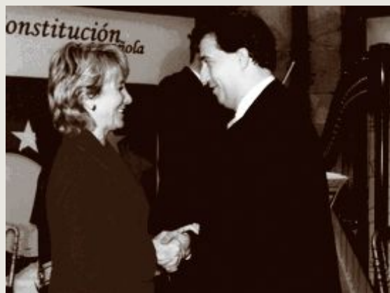
Saludando a la Presidenta de la Comunidad de Madrid, Doña Esperanza Aguirre